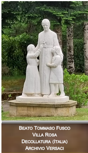
BEATO TOMMASO FUSCO VILLA ROSA DECOLLATURA (ITALIA)