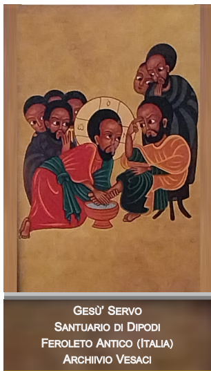
GESÙ SERVO SANTUARIO DI DIPODI FEROLETO ANTICO (ITALIA) ARCHIVIO VESACI