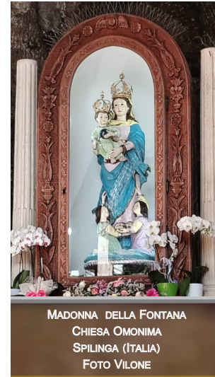
MADONNA DELLA FONTANA CHIESA OMONIMA SPILINGA (ITALIA)