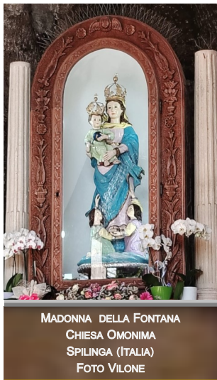
MADONNA DELLA FONTANA CHIESA OMONIMA SPILINGA (ITALIA)