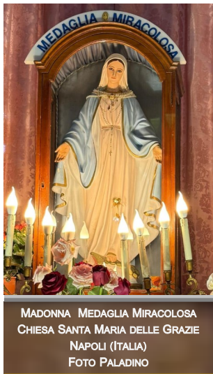
MADONNA MEDAGLIA MIRACOLOSA CHIESA SANTA MARIA DELLE GRAZIE NAPOLI (ITALIA)