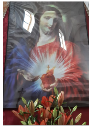
SACRO CUORE DI GESU' SANTUARIO SAN DOMENICO SORIANO CALABRO (ITALIA)