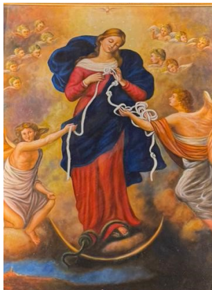
MADONNA CHE SCIOGLIE I NODI CHIESA PIETA' DEI TURCHINI NAPOLI (ITALIA)