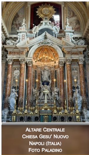
ALTARE CENTRALE CHIESA GESU' NUOVO NAPOLI (ITALIA)