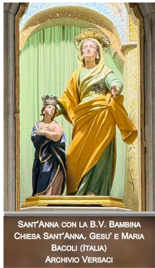
SANT'ANNA CON LA B.V. BAMBINA CHIESA SANT'ANNA, GESU' E MARIA BACOLI (ITALIA) ARCHIVIO VERSACI