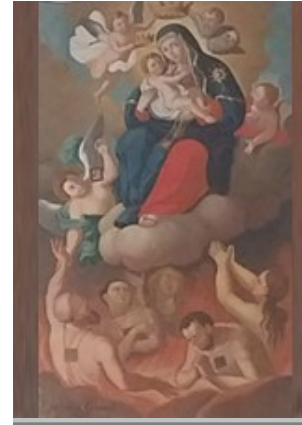
MADONNA DEL CARMELO CHIESA MARIA SS. DELLE GRAZIE LAMEZIA TERME (ITALIA) ARCHIVIO VERSACI