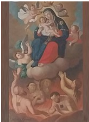
MADONNA DEL CARMELO CHIESA MARIA SS. DELLE GRAZIE LAMEZIA TERME (ITALIA)

Per il nostro Signore Gesù Cristo che è Dio, e vive e regna con te, nell'unità dello Spirito Santo, per tutti i secoli dei secoli. A - Amen.