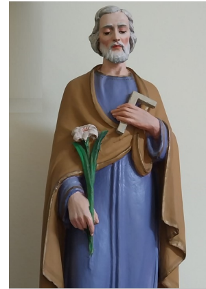
SAN GIUSEPPE CHIESA MADONNA DEL SOCCORSO LAMEZIA TERME (ITALIA)