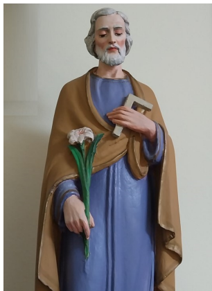
SAN GIUSEPPE CHIESA MADONNA DEL SOCCORSO LAMEZIA TERME (ITALIA)