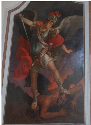
SAN MICHELE ARCANGELO CHIESA MARIA SS. DELLE GRAZIE LAMEZIA TERME (ITALIA)