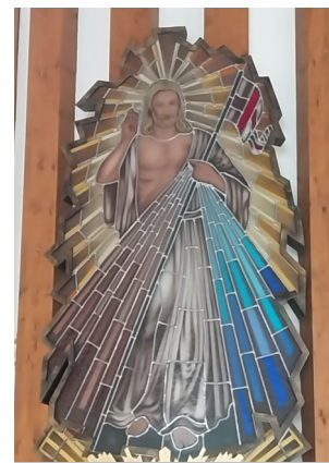
GESU' MISERICORDIOSO SANTURAIO SAN GIOVANN PAOLO II FEROLETO ANTICO (ITALIA)