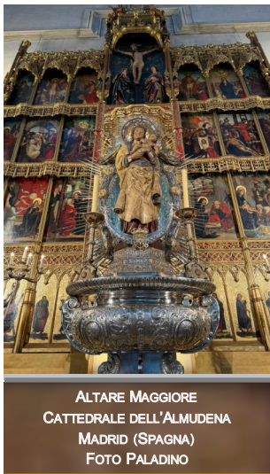
ALTARE MAGGIORE CATTEDRALE DELL'ALMUDENA MADRID (SPAGNA)

Egli è Dio, e vive e regna con te, nell'unità dello Spirito Santo, per tutti i secoli dei secoli. A - Amen.