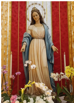
MADONNA DEL MIRACOLO SANTUARIO SAN FRANCESCO DI PAOLA LAMEZIA TERME (ITALIA)