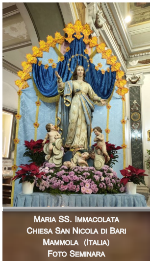
MARIA SS. IMMACOLATA CHIESA SAN NICOLA DI BARI MAMMOLA (ITALIA)